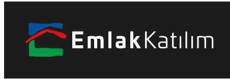
Siyah zemin üzerinde logonun renkli kullanımı