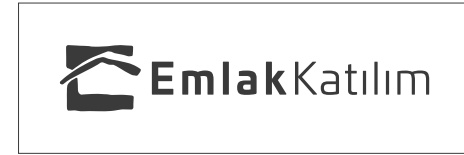
Faks, gazete ilanı gibi uygulama alanları için tek renk siyah kullanım